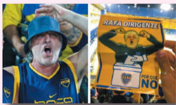
Xeneize, sobre la determinación que le comunicó el jefe de La 12.