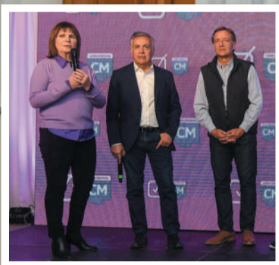
Cornejo ganó las PASO en Mendoza y Bullrich se sumó