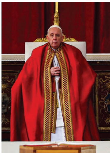
Un total de 50.000 personas participaron del funeral, la mitad de las previstas, de acuerdo con lo informado por la oficina de Prensa de

El papa Francisco despidió ayer al "pastor" Benedicto XVI al presidir ante 50.000 personas en la Plaza San Pedro el funeral del pontífice emérito fallecido el sábado a los 95 años, de quien destacó su "sabiduría, delicadeza y entrega", en una ceremonia que culminó con la inhumación del cuerpo de Joseph Ratzinger en la Basílica vaticana. "Es el Pueblo fiel de Dios que, reunido, acompaña y confía la vida de quien fuera su pastor", planteó Francisco durante la homilía de la misa con la que, en un hecho inédito para la historia moderna de la Iglesia, un pontífice en funciones encabezó las exequias de uno emérito, Ratzinger, Papa reinante entre 2005 y su renuncia de febrero de 2013.