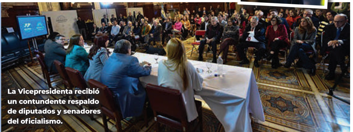
La Vicepresidenta recibió un contundente respaldo de diputados y senadores del oficialismo.