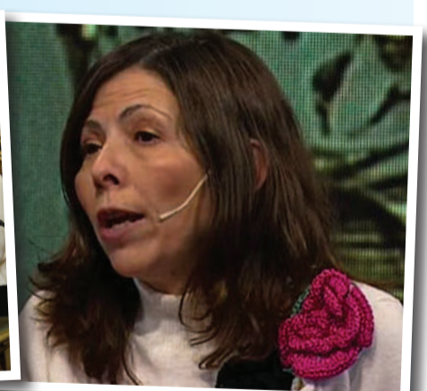
El primer día de la flamante ministra fue muy agitado. Visitó Olivos y se reunió con el titular del BCRA y el ex ministro Guzmán. A la tarde juró y después dio una entrevista en C5N.