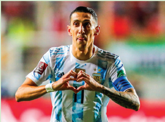
Juventus, última escala de Fideo antes del Mundial

Ángel Di María tiene un acuerdo con Juventus, que lo anunciará como refuerzo por una temporada. En Central sueñan con repatriarlo en 2023.