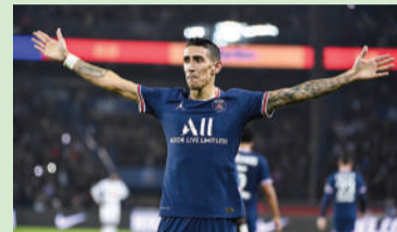
PSG no le quiso renovar.