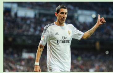
Madrid. Campeón de Europa.

Estuvo siete años en París, donde enamoró a los hinchas de PSG y se maravilló con una ciudad a la que tomó como una segunda casa. Antes de recalcar en el poderoso club de la capital francesa, había tenido una temporada para el olvido en Manchester United, en el que jamás pudo mostrar su mejor versión ni recibió la bienvenida de un público muy celoso de sus actuaciones. Antes de aquel paso sin gloria en los Diablos Rojos, había deslumbrado a Europa y al