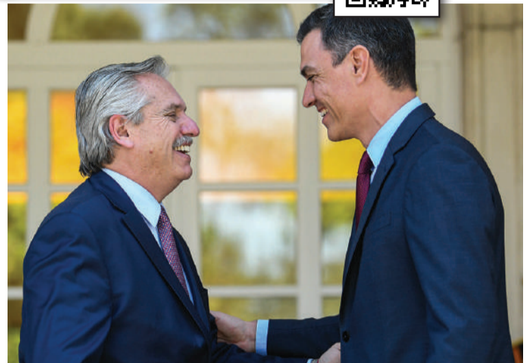
El presidente Fernández y el presidente del gobierno español Pedro Sánchez Pérez-Castejón.

En el marco de la visita oficial a España, Francia y Alemania, Alberto Fernández dio una entrevista, en clave de política interna, al diario El País . Habló de su vice: "Tengo un enorme respeto por Cristina, pero hay cosas que no comparto de su mirada". Ponderó la gestión de Guzmán en Economía, "vendió" el gas de Vaca Muerta y dijo que "el daño que hizo Macri es incalculable".