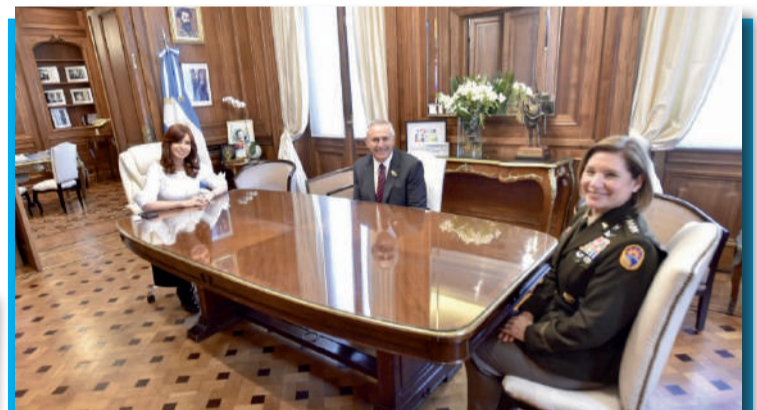
Cristina Fernández de Kirchner recibió en su despacho del Senado a la generala Laura Jane Richardson, "comandante del Comando Sur de los Estados Unidos, primera mujer en ocupar ese cargo en la historia", escribió la vicepresidenta en su cuenta de Twitter.