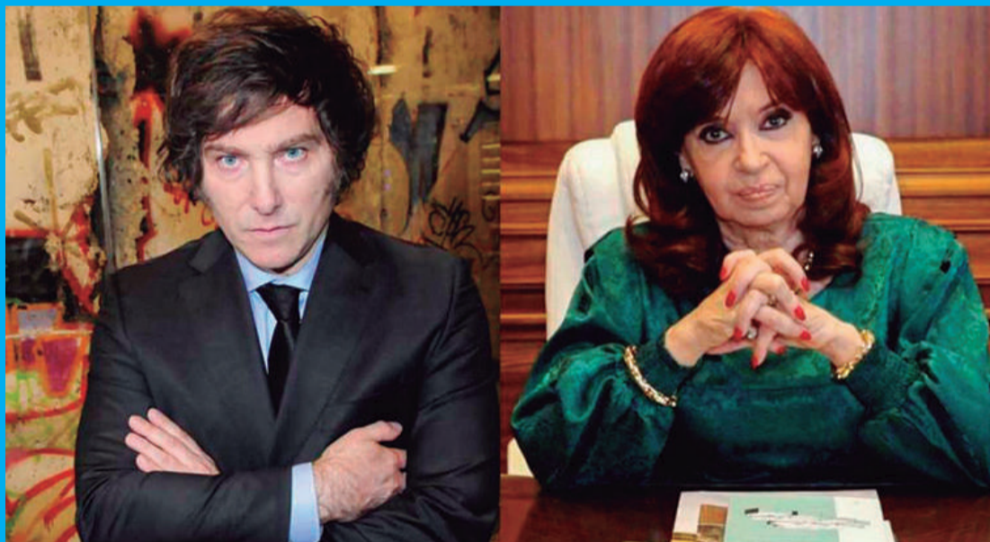
Una encuesta de la consultora Opinaia ubica a Cristina Fernández de Kirchner y a Javier Milei como los más votados para representar al oficialismo y la oposición en 2023.

El jefe de los senadores del Frente de Todos, José Mayans, declaró que es "obligación y responsabilidad" de los legisladores "alcanzar la resolución de estos problemas" y "buscar caminos que lleven a la independencia económica" del país.