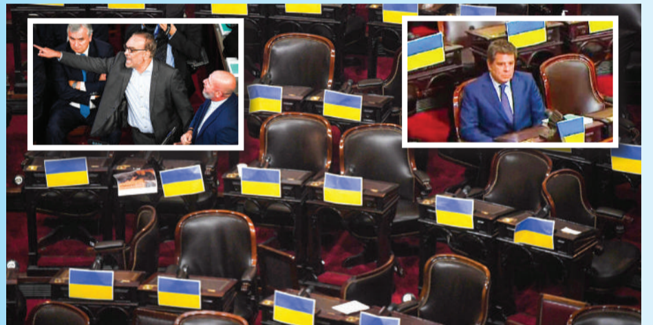
Juntos eligió abandonar el recinto (menos Manes), cuando se habló de la deuda con el FMI.