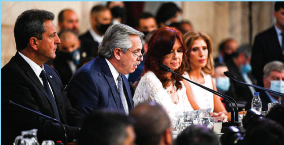
El oficialismo se mostró unido detrás del discurso presidencial.

Alberto exhibió también números muy positivos en el agro, petróleo, minería, el sector automotriz, turismo y la industria del software. Envió el proyecto de Ley de Empleo Joven y aseguró que no habrá reforma laboral ni subirá la edad para jubilarse. Cuando habló de investigar la toma de deuda externa por parte del macrismo, Juntos se fue del recinto, menos el diputado Manes.