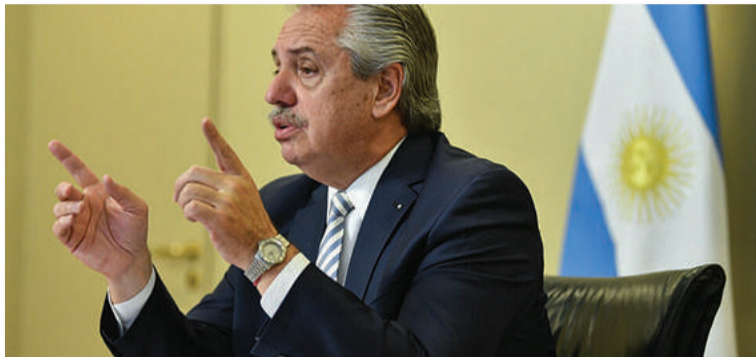
Fernández habló en un foro convocado por la OIT

Fernández afirmó además que “la Argentina se encuentra en el proceso de negociación de su deuda externa y busca los equilibrios redirigidos hacia el espíritu de la nueva normalidad que las