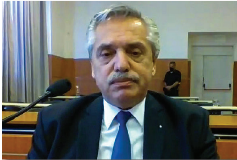
El Presidente declaró durante más de tres horas en Comodoro Py.

A lberto Fernández negó ayer la existencia de arbitrariedades en la distribución de obra pública nacional y dijo desconocer la existencia de un "acuerdo de voluntades" para direccionar obra pública en los gobiernos kirchneristas. El Presidente sostuvo que se está juzgando a Cristina Fernández de Kirchner por "decisiones políticas no judiciales". Fernández declaró como testigo durante más de tres horas, tras ser citado por su rol como jefe de