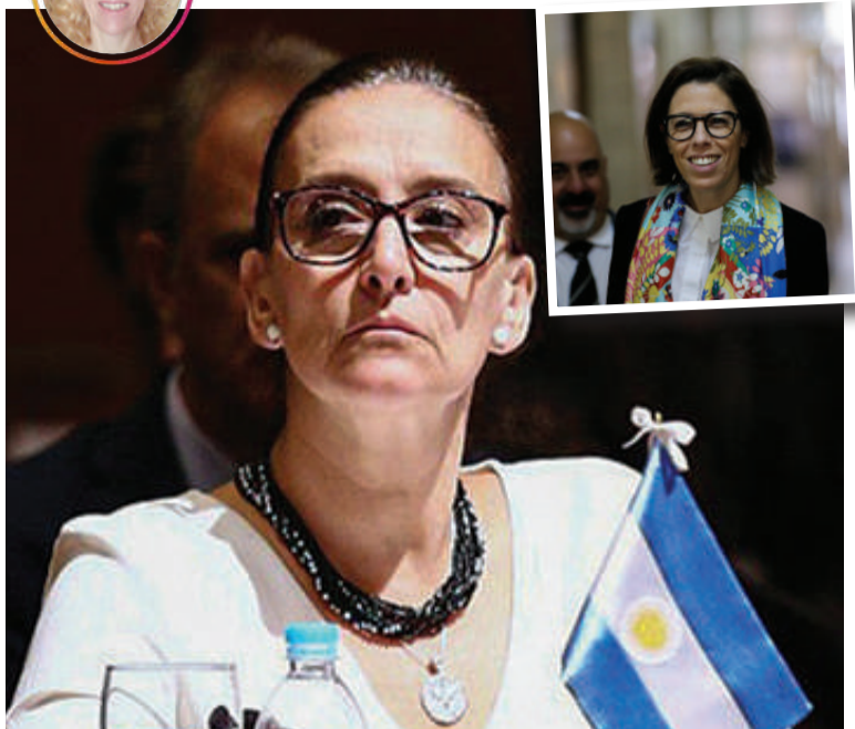
La conducta de Michetti será investigada por la renovada Oficina Anticorrupción.