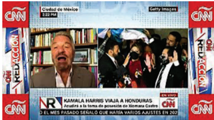
¿La vice de Biden se reunirá con Cristina?

“Es muy difícil porque cuando una mujer, además de pintarse, peinarse y ponerse un atuendo, piensa, y se atreve a decirlo en voz alta, se lo perdonan bastante menos que a los hombres”, reflexionó la vicepresidenta.