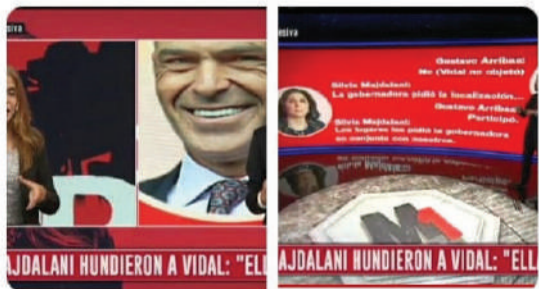
21:12 · 26 ene. 22 · Twitter for Android

ATENCIÓN!!! Bombazo en minuto uno!! según Arribas y Majdalani en la comisión bicameral dijeron que Vidal no solo armo causa sino que participó con la AFI en crear más bases espías para actuar contra distintas entidades! se le cierra el círculo a la hiena! 🚗 continuara..