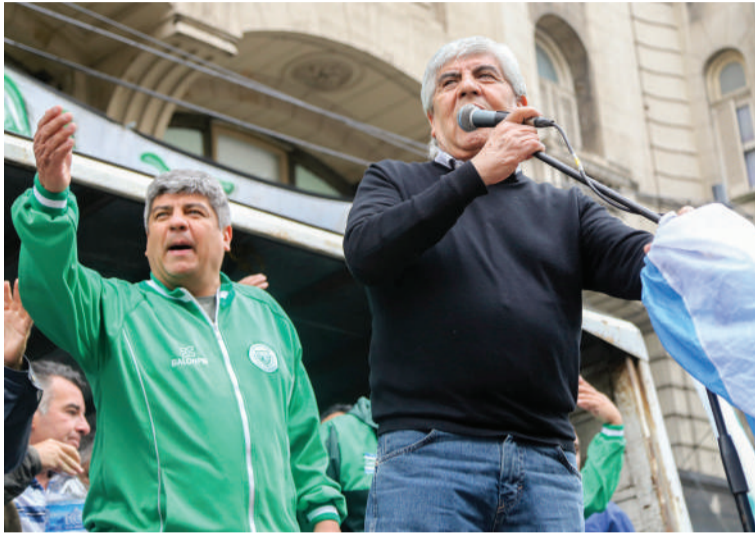
A 15 días de la marcha, comienza a sumar voluntades.

Pese a que la oposición se esforzó por encasillar la acción como "una marcha k" y convocó a una contramarcha "en defensa de la Corte Suprema" dos días después, la legitimidad de la medida crece porque es evidente la necesidad de contar con una justicia que responda a los intereses populares. Las tensiones al interior de la