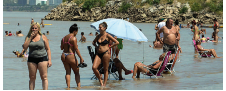
El calor agobiante no cedió, pese a la llegada de las lluvias.